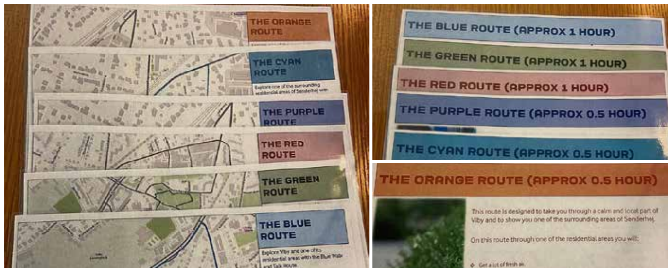
Gå-ruter til Walk & Talk-møder hos Arla.